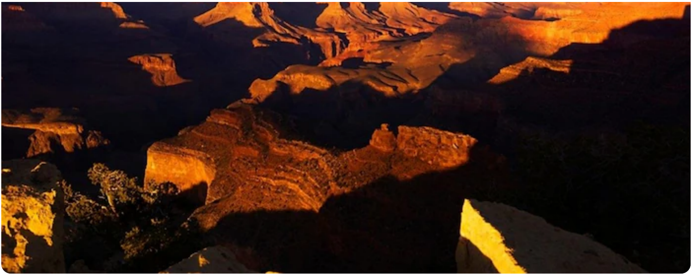
Le Grand Canyon fait partie des terres desquelles les Autochtones ont été chassés. (Photo d'archives)